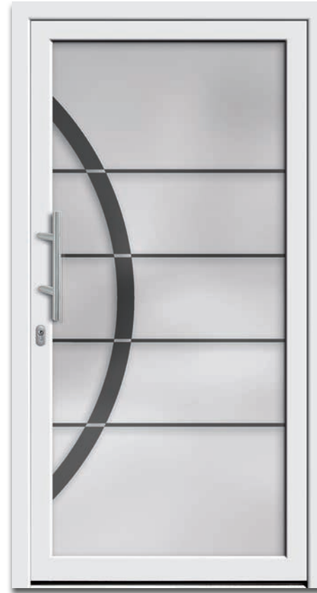
Modell 6229-01 | 2-fach Verglasung: mattiertes Glas mit klarem Motiv und klaren Streifen | Griff: 9022-13 Edelstahl