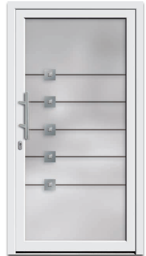
Modell 6216-07 | 3-fach Verglasung: mattiertes Glas mit klarem Streifen | Applikationen – Quadrate in Edelstahloptik mit klarem Glassteinen | Griff: 9022-13 Edelstahl