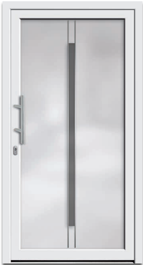
Modell 6206-05 | 3-fach Verglasung: mittlere Scheibe ESG | mattiertes Glas mit klarem Streifen | Applikationen – Edelstahl-Lisenen | Griff: 9022-13 Edelstahl