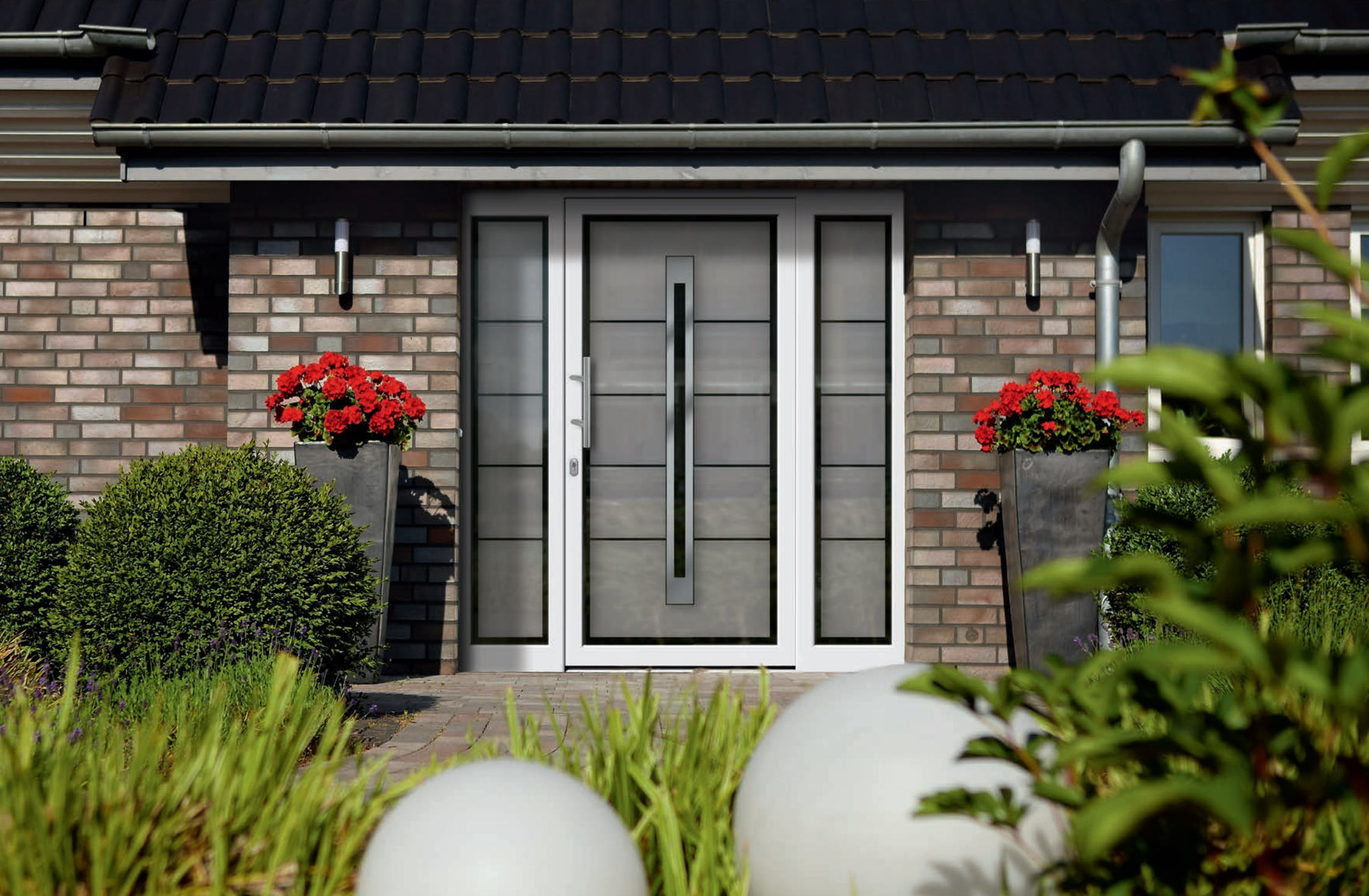
Modell 6272-07 mit Ganzglas-Seitenteilen | 3-fach Verglasung: mittlere Scheibe ESG | mattiertes Glas mit klarem Rand, Motiv und Streifen klar | Applikation – Edelstahl | Griff: 9022-13 Edelstahl