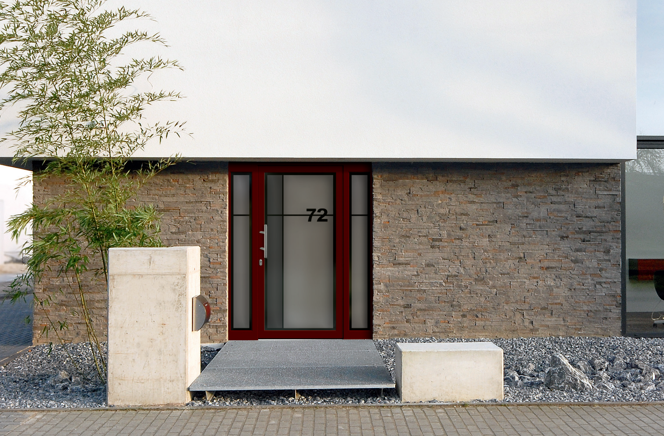
Modell 6275-01 | 2-fach Verglasung: mattiertes und grau-mattiertes Glas mit klarem Rand, Hausnummer und Streifen klar | Griff: 9022-13 Edelstahl | Seitenteil Variante C Hausnummer wird individuell in der abgebildeten Schriftart gefertigt.