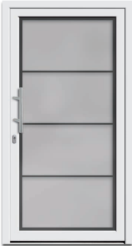
Modell 6223-01 | 2-fach Verglasung: mattiertes Glas mit klarem Rand und klaren Streifen | Griff: 9022-13 Edelstahl