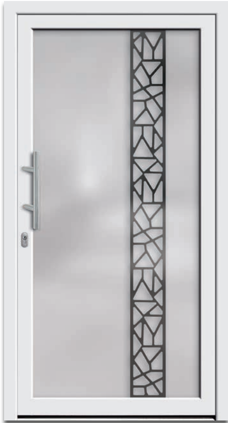
Modell 6217-01 | 2-fach Verglasung: mattiertes Glas mit klarem Motiv | Griff: 9022-13 Edelstahl