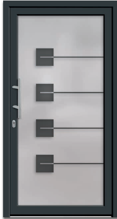
Modell 6222-01 | 2-fach Verglasung: mattiertes Glas mit klaren Streifen und klaren Quadraten | Griff: 9022-13 Edelstahl