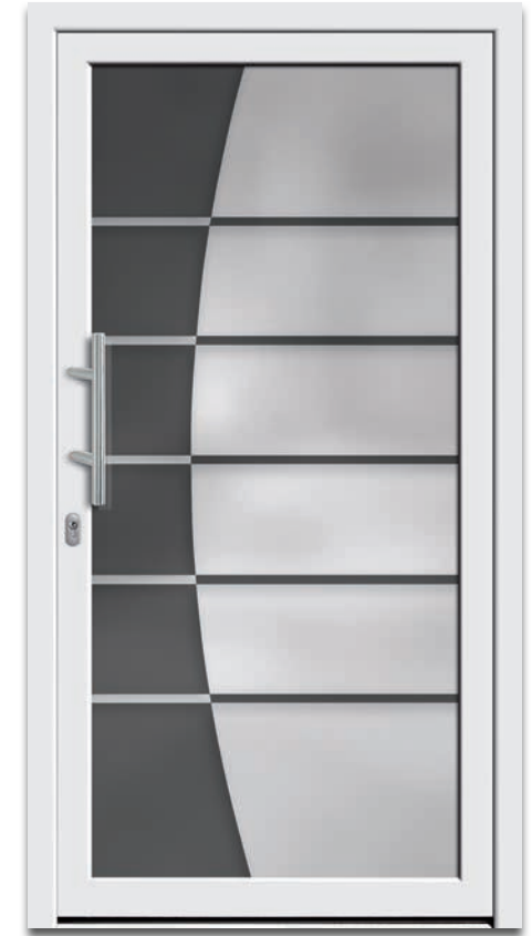
Modell 6242-01 | 2-fach Verglasung: mattiertes Glas mit klaren Streifen und klarem Motiv | Griff: 9022-13 Edelstahl