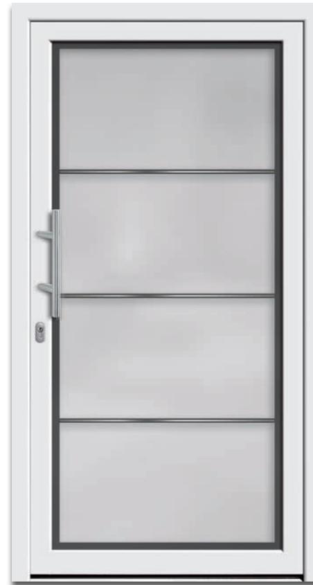
Modell 6203-05 | 3-fach Verglasung: mittlere Scheibe ESG | mattiertes Glas mit klarem Rand und klarem Streifen | Applikationen – Edelstahl-Lisenen | Griff: 9022-13 Edelstahl