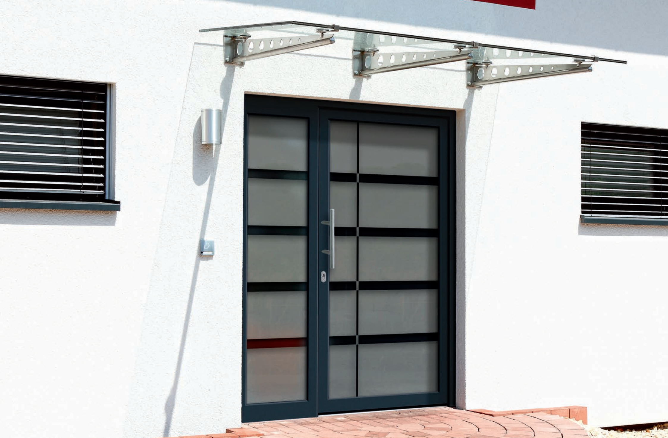
Modell 6289-01 mit Ganzglas-Seitenteil | 2-fach Verglasung: mattiertes Glas mit klaren Streifen | Griff: 9022-13 Edelstahl | Seitenteil Variante C