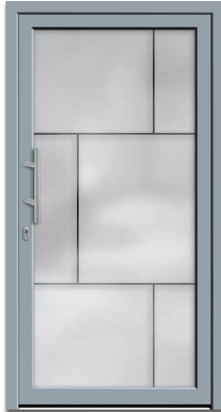
Modell 6218-01 | 2-fach Verglasung: mattiertes Glas mit klaren Streifen | Griff: 9022-13 Edelstahl