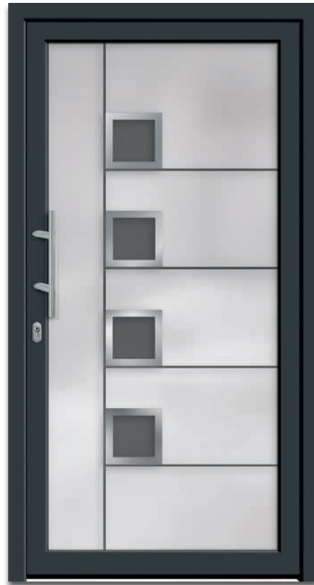
Modell 6211-07 | 3-fach Verglasung: mittlere Scheibe ESG | mattiertes Glas mit klarem Streifen und klaren Quadraten | Applikationen – Edelstahl | Griff: 9022-13 Edelstahl