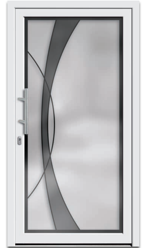
Modell 6295-01 | 2-fach Verglasung: mattiertes Glas mit klarem Rand und halbtransparentem Motiv | Griff: 9022-13 Edelstahl