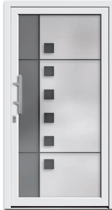
Modell 6230-01 | 2-fach Verglasung: mattiertes und grau-mattiertes Glas mit klaren Streifen und klaren Quadraten | Griff: 9022-13 Edelstahl